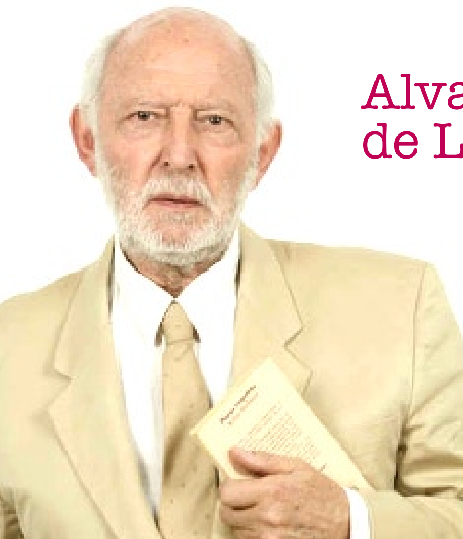
Alvaro de Luna

Ha actuado en numerosas películas y series de TV como “Silencio Roto” (Premio Cine Vasco), “Teo, el pelirrojo” (Premio del Festival de Gijón al mejor actor), “Dulces horas” (Premio de la crítica de Nueva York), “La Barraca” (TP de Oro), “Curro Jiménez” (TP de Oro, Premio Mejor Actor de Europa de TV), “El prado de las estrellas” de Mario Camus, “¿Y tú quien eres?” de Antonio Mercero, “El viaje de Carol” de Imanol Uribe.